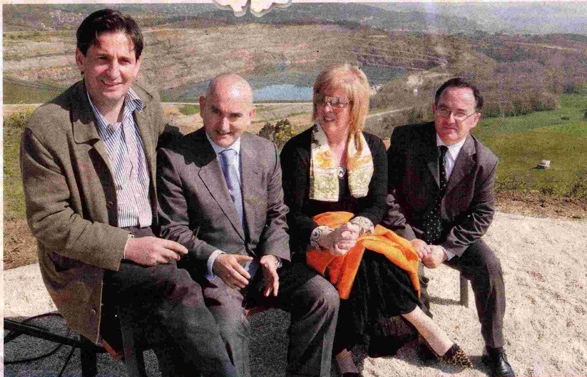
LOS ALCALDES DEL BESAYA UNIFICAN PROYECTOS