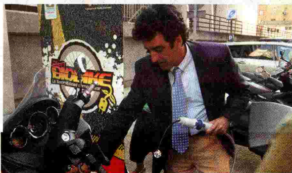
Martín presentó la nueva propuesta ecológica.

Tras la reunión, celebrada en la sede de CEOE-CEPYME, los representantes de los concesionarios y empresas de recambios han comprobado in situ el funcionamiento de las motocicletas y las principales prestaciones de este tipo de vehículos ecológicos.